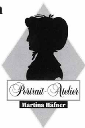
Foto-Arbeiten Filme Zubehör

Hauptstraße 65 · 63619 Bad Orb · Telefon: 0 60 52-71 71