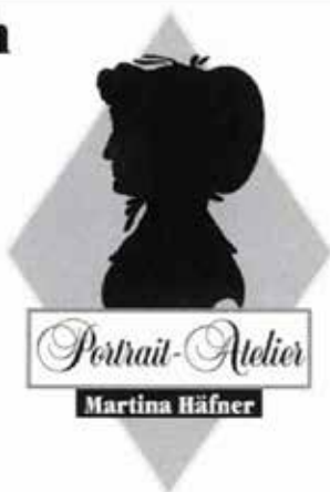
Foto-Arbeiten Filme Zubehör

Hauptstraße 65 · 63619 Bad Orb · Telefon: 0 60 52-71 71