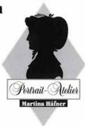
Foto-Arbeiten Filme Zubehör

Hauptstraße 65 · 63619 Bad Orb · Telefon: 0 60 52-71 71